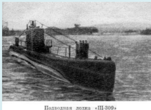
Подводная лодка «Щ-309»