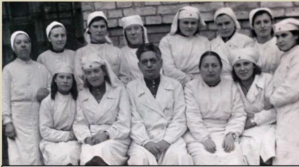
19.02.1944год. Суволоки, Польша. Первое отделение эвакогоспиталя 1982.