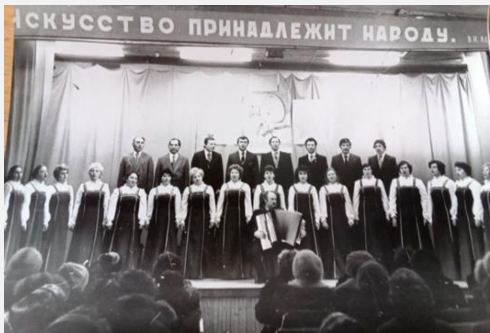
Смотр художественной самодеятельности в Хиславичском ДК (1984 г.)

Фонд библиотеки в 1981 году составлял 6679 экз. книг. В эти годы в колхозе трудилось много молодёжи. Жили интересно, было большое желание работать. В библиотеке активно велась работа по пропаганде литературы, проводились тематические, музыкальные вечера, встречи с ветеранами войны и труда, читательские конференции, диспуты.