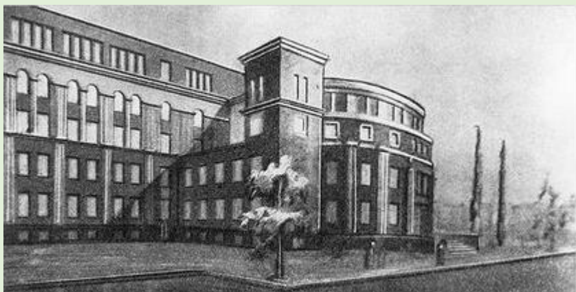
Главный корпус СГМИ. 1940 г.