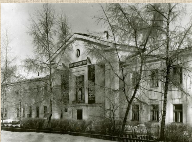
Правление шахты № 21 1985 г.