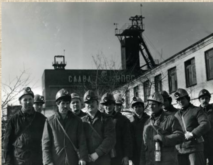
Шахта № 3 «Западная» «Щекиноуголь»