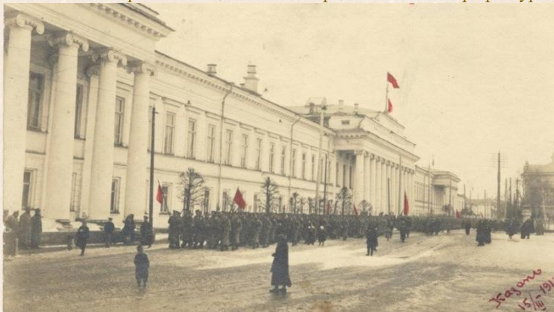
Казанский университет в 1917 году