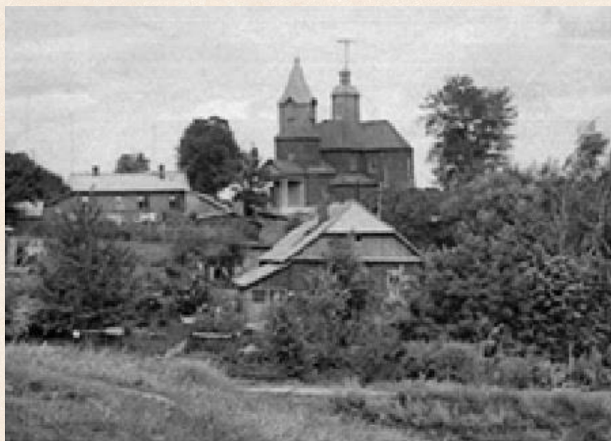
м. Хиславичи, вид на Борисоглебскую церковь