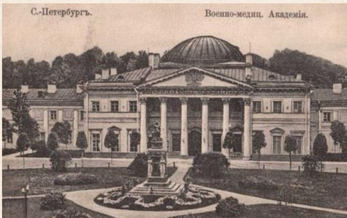
Санкт-Петербургская императорская Военно-медицинская академия