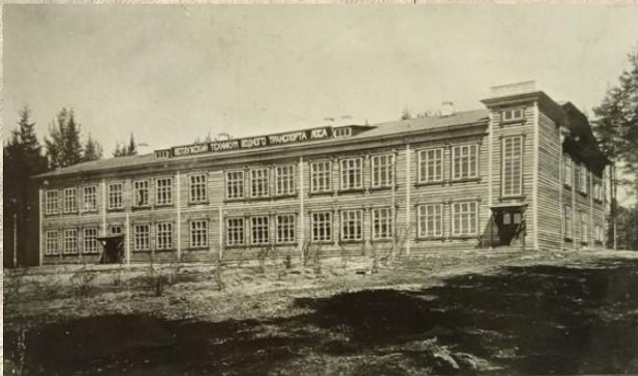
Здание Ветлужского лесоагротехнического техникума 1933-1935 г.г.

С февраля 1934 г. по 5 октября 1935 г. учился в Ветлужском лесоагротехническом техникуме. По семейным обстоятельствам (отец стал жертвой политических репрессий) выбыл с 3 курса и снова стал учителем. С октября 1935 г. по февраль 1940 г. работал учителем Лызковской неполной средней школы. В 1938 году поступил в Смоленский пединститут на заочное обучение.