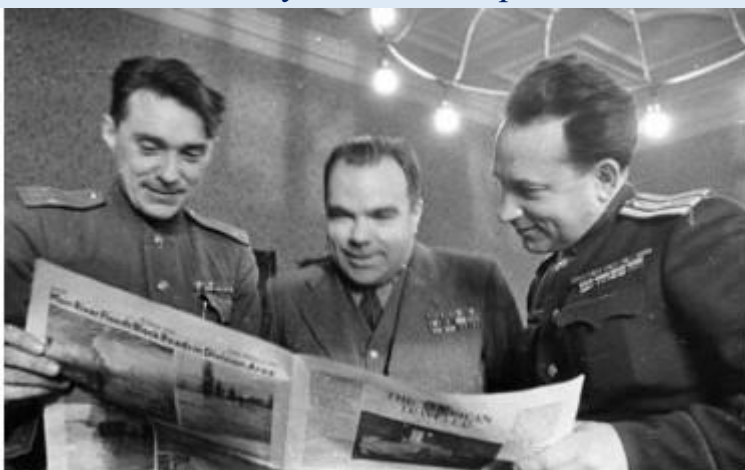
Б. Полевой на Нюрнбергском процессе (первый слева)

врага дали ему силы встать на ноги...на протезы. И даже на протезах опять воевать за свободу и счастье страны.