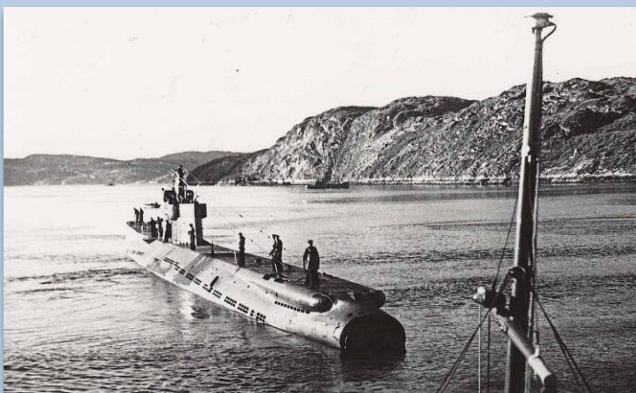
Подводная лодка «Л-20»

Субмарина «Л-20» относилась к классу дизель-электрических подводных минных заградителей типа «Ленинец». Ее основной задачей была установка морских мин. После прохождения краткого курса боевой подготовки подводная лодка 11 октября перешла из Архангельска в Полярное, откуда вечером 28 октября отправилась в свой первый боевой поход с задачей постановки мин в глубине Конгс-фьорда. План похода не предусматривал действие подводной лодки в торпедном варианте, поэтому, выполнив задачу, подлодка вернулась в Полярное.