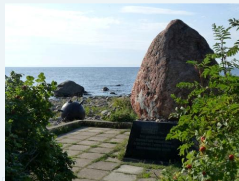
Мемориал погибшим на мысе Юминда

История Великой Отечественной войны полна множеством героических страниц. Однако некоторые из них впечатляют особо, прежде всего это относится к событиям первых месяцев войны, когда вермахт стремительно теснил