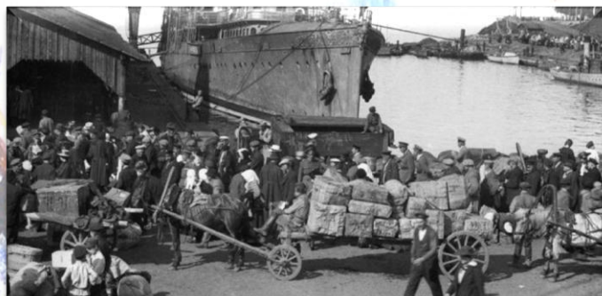
Эвакуация из Таллина

флота ещё с начала июля 1941 года, но решение было принято только сейчас.